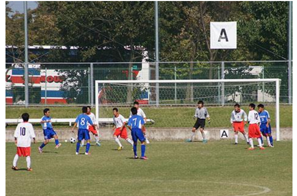
試合結果は2：1で北海道の勝利