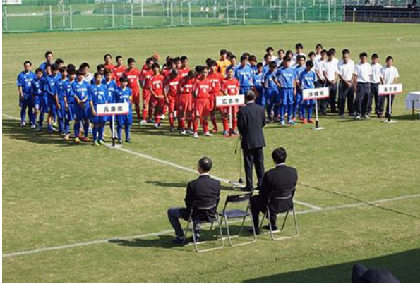
障害者サッカー競技開始式