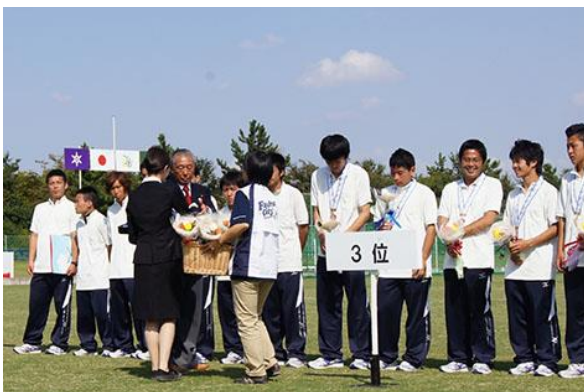
第3位チームへメダルを授与する 府中市サッカー連盟市村副会長