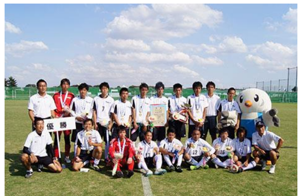
優勝に輝いた東京都チーム