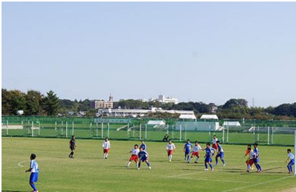
沖縄県と北海道の南北の対決