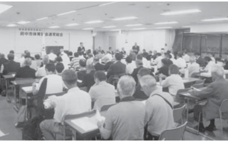
平成22年度通常総会

去る、6月10日に開催されました通常総会で、任期満了に伴う役員改選が行われ、はからずも会長に再選され就任いたしました。微力ではございますが、引き続き市民スポーツの振興と健康増進に邁進する所存でございます。 また、今年が多摩市町村の長年の懸案でございました平成25年に開催予定の第68回国民体育大会並びに第13回全国障害者スポーツ大会、通称「東京多摩国体」の開催が正式決定され本格的な準備態勢に入りました。体協も国体の成功に向けて府中市に協力をおしよる所存です。それには、市民スポーツの振興と併せて、会員皆さまのご協力、ご指導、ご鞭撻を賜りますようお願いいたします。