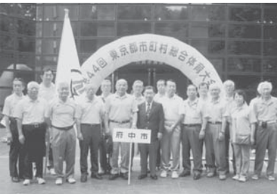
第44回市町村総合体育大会開会式